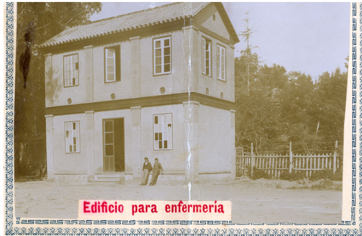
Politécnica de Málaga