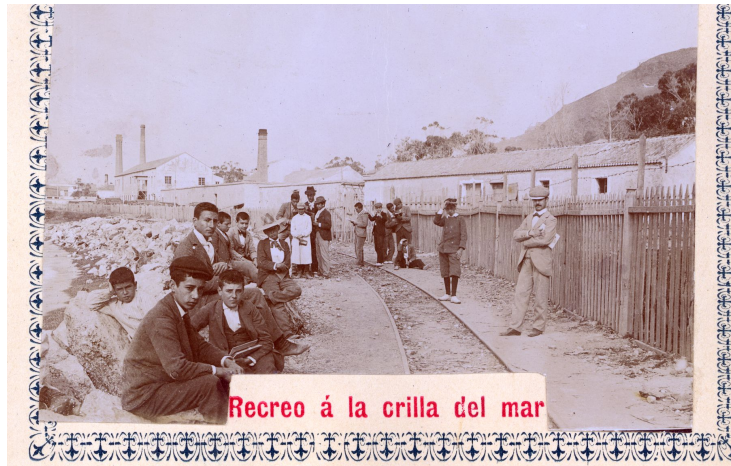
Politécnica de Málaga