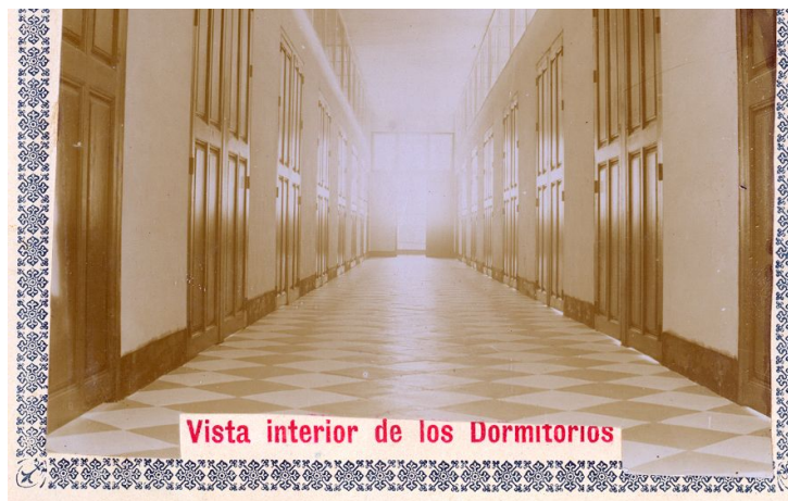
Politécnica de Málaga