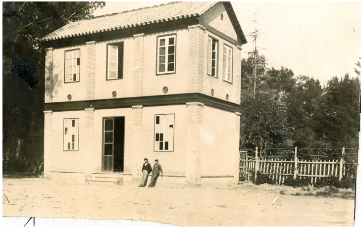
Politécnica de Málaga