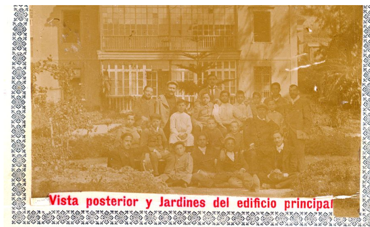
Politécnica de Málaga