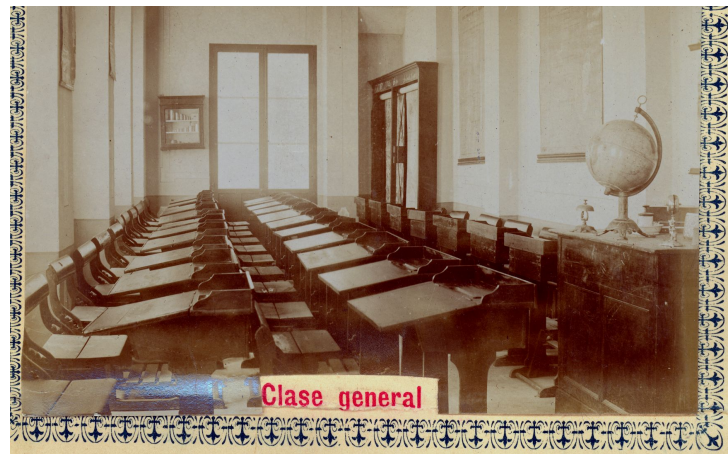
Politécnica de Málaga