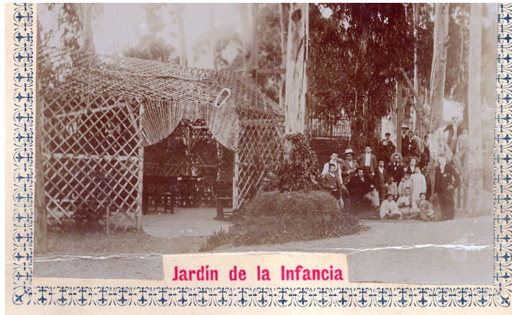
Politécnica de Málaga