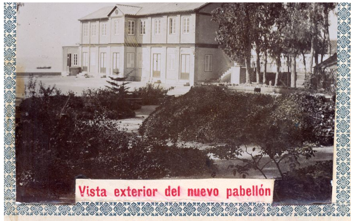
Politécnica de Málaga