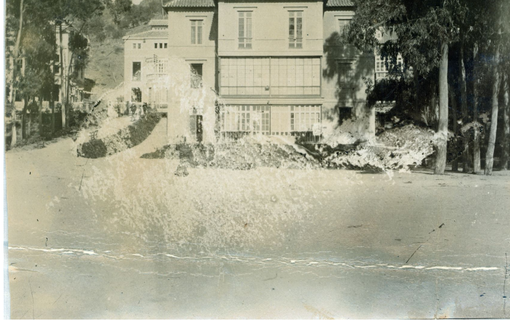
Politécnica de Málaga