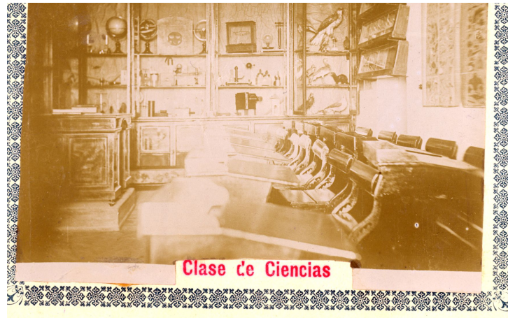
Politécnica de Málaga