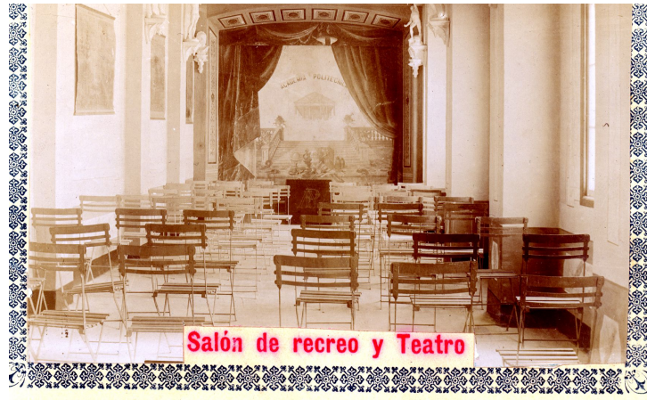
Salón de recreo y Teatro