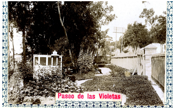
Paseo de las Violetas