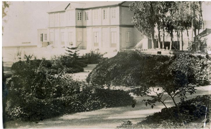
Politécnica de Málaga