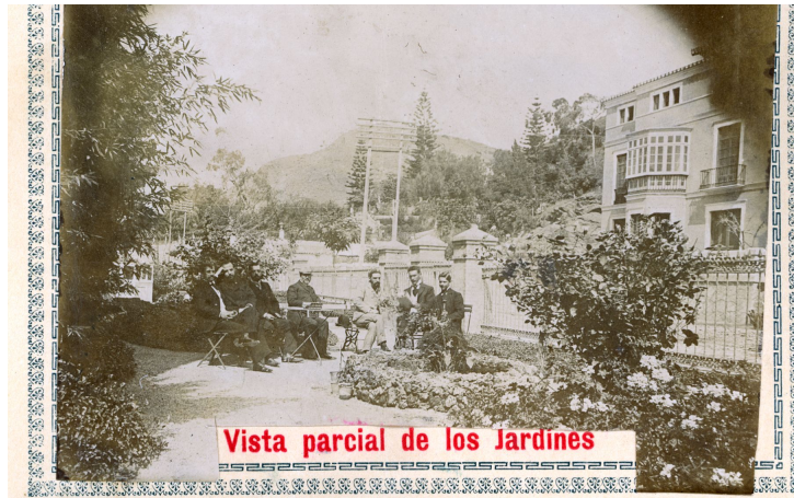
Politécnica de Málaga