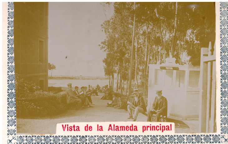
Politécnica de Málaga