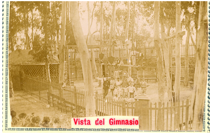
Politécnica de Málaga