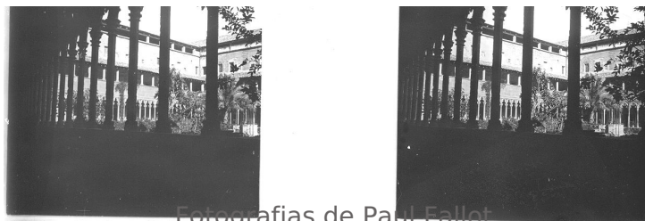
Fotografias de Paul Fallot