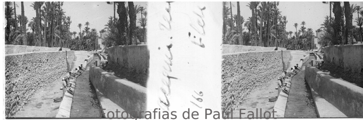
Fotografias de Paul Fallot