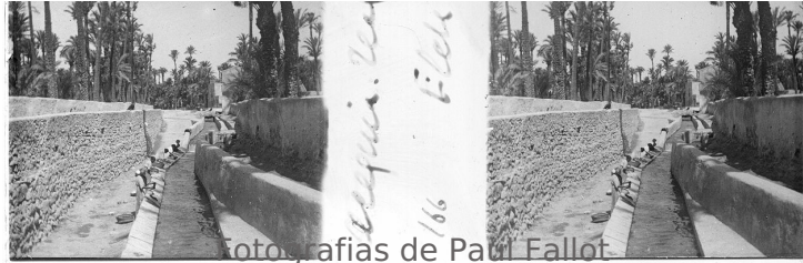
Fotografias de Paul Fallot