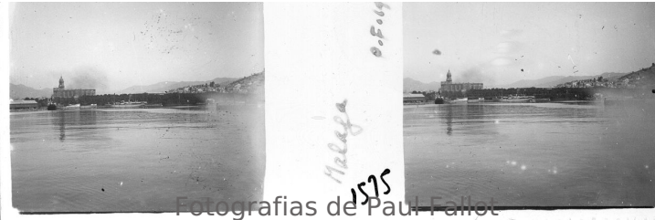
Fotografias de Paul Fallot