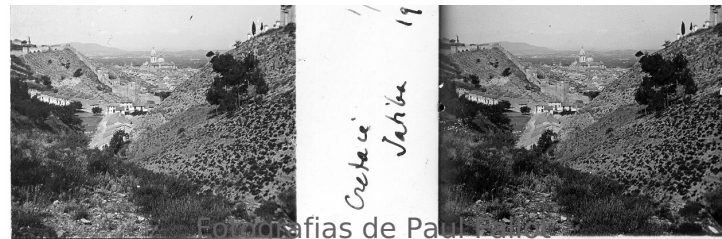
Fotografias de Paul Fallot