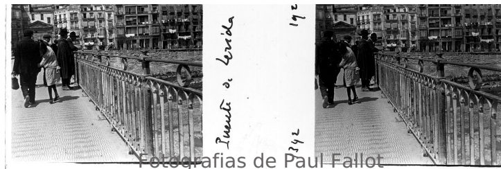
Fotografías de Paul Fallot

Su legado incluye, entre otros materiales, una amplia colección de placas de vidrio estereoscópicas en positivo, junto con negativos fotográficos también en soporte vidrio, que recogen parajes naturales e incluso urbanos de las zonas estudiadas por el investigador a principios de siglo, de gran curiosidad e interés.