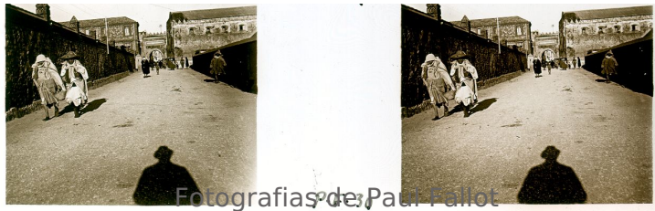
Fotografias de Paul Fallot