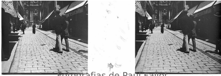
Fotografías de Paul Faillot