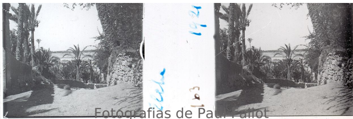
Fotografias de Paul Fallot