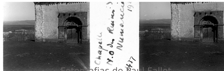
Fotografías de Paul Fallot