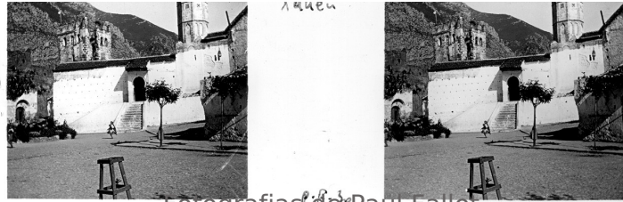
Fotografias de Paul Fallot